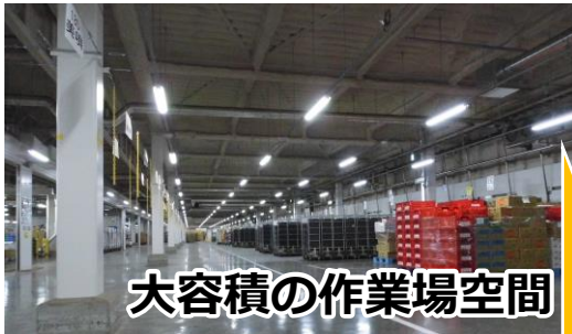
大容積の作業場空間